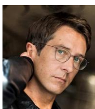
@Astrid di Crollanza